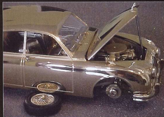
Die Reifen sind aus schwarzem Onyx

Pro Modell müssen etwa 70 Gussformen gebaut werden. Und gerade sie sind das "Geheimnis" seiner einzigartigen Modelle. Bei der Fertigung